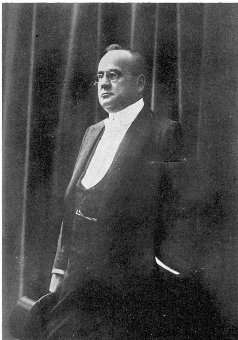
Aurel C. Popovici