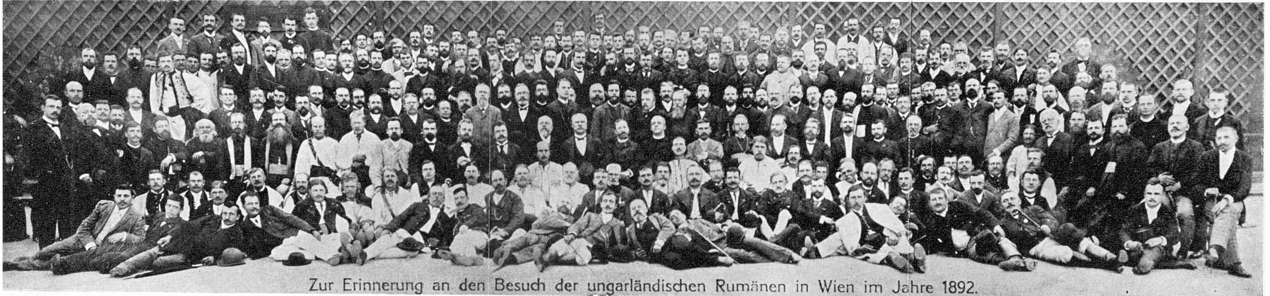
Zur Erinnerung an den Besuch der ungarländischen Rumänen in Wien im Jahre 1892.

In amintirea vizitei Românilor transilvăneni la Viena în 1892