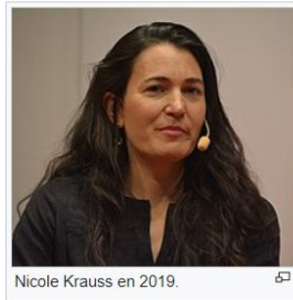
Nicole Krauss en 2019.

La grande maison , 2010 [ modifier ] modifier le wikicode ]