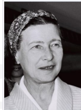
Simone de Beauvoir en 1967.